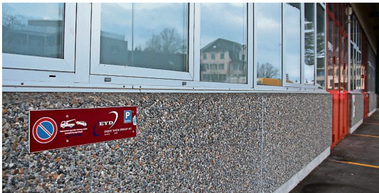
Die Firma Enjoy your dream vermietete Luxusautos zu tiefen Preisen. Die Kunden erhielten ihre Kautions jedoch nicht zurück. jac

«Bei 'Enjoy your dream' haben unzählige Kunden ihre Kautions nie zurückerhalten. 1000 bis 2000 Franken pro Miete», schreibt der «Beobachter» in einem Artikel, der vor zwei Tagen erschienen ist. Jetzt ist die Firma pleite und die Türen sind