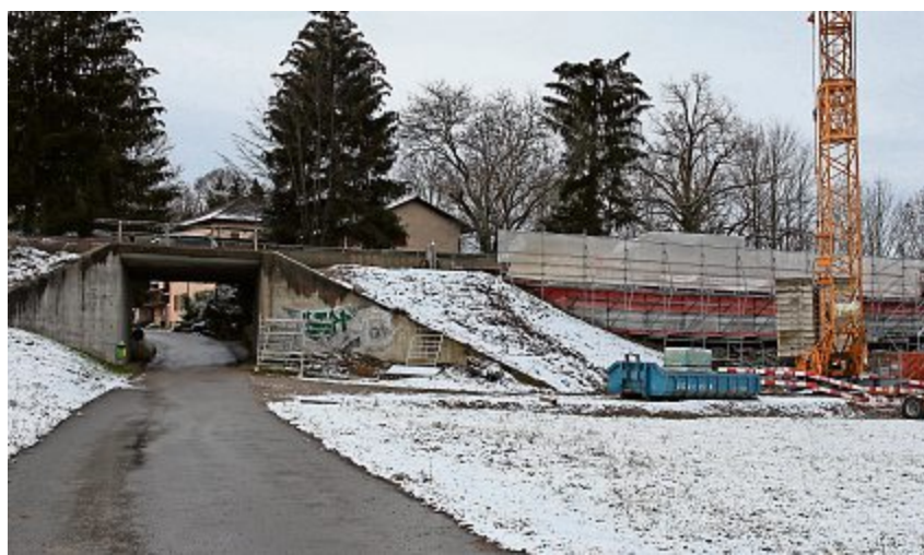
Die Unterführung Kirchstrasse in Wil und Rickenbach wird während zwei Monaten saniert. Die Fuss- und Radwegverbindung ist während dieser Zeit gesperrt. jac

Der Baustart fand schon vor einiger Zeit statt, jedoch lag der Fokus bis anhin auf dem Viadukt. Die Win-