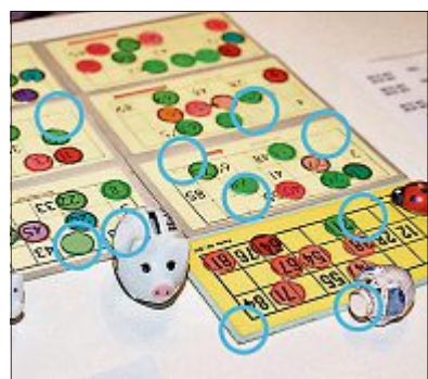
Auflösung der letzten Ausgabe

Das linke Bild ist das Original, im rechten haben sich 10 Fehler eingeschlichen. Finden Sie diese und schicken Sie das Bild, mit den eingekreisten Fehlern, bis nächsten Montag an: Wilner Nachrichten, «10 Fehler», Hubstrasse 66, 9500 Wil (Absender nicht vergessen). Unter den richtigen Einsendungen wird ein/e Gewinner/in ausgelost und erhält 20 Franken in bar. Der Gewinn kann auf der Redaktion an der Hubstrasse 66 in Wil abgeholt werden.